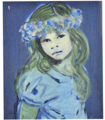
1_ Claire Tabouret, Les Diadèmes, fleurs bleues , 2014, acrylique sur toile.